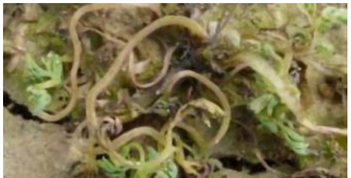
Duivekervel na toepassing Pixxaro