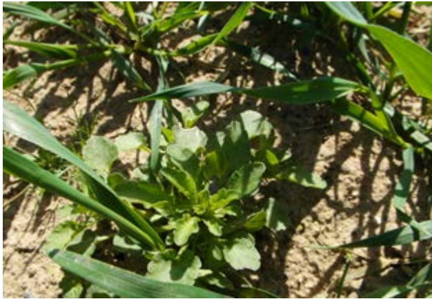
Akkerviooltje wordt door Capri Twin effectief bestreden

Wanneer er geen grasachtige onkruiden aanwezig zijn, dan is ons basisadvies: