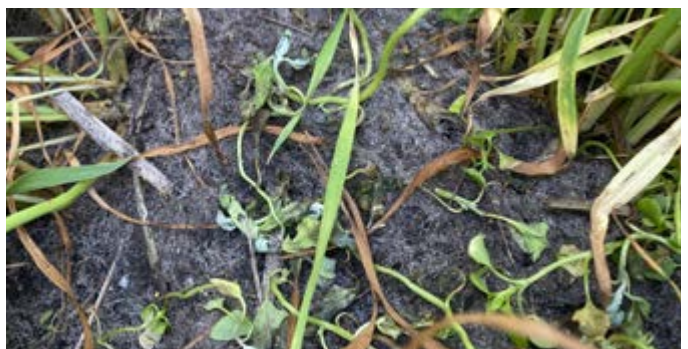
Melganzevoet na toepassing Pixxaro