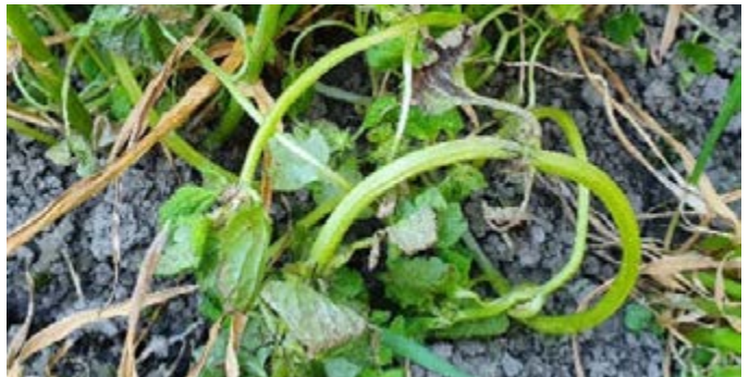
Paarse dovenetel na toepassing Pixxaro