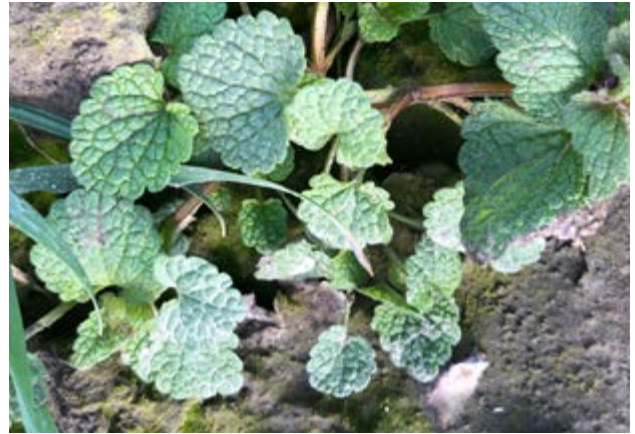
Paarse dovenetel en hoenderbeet worden door Pixxaro effectief bestreden

Hiermee bestrijdt u de onkruiden zoals kamille, kleefkruid, klein kruiskruid, muur, hennepnetel, herderstasje, kleine brandnetel, herik, perzikkruid, varkensgras, zwaluwtong, paarse dovenetel, hoenderbeet, duivekervel en melganzevoet.